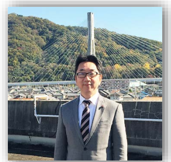
川西市役所の屋上からビッグハープを背にして

本年、新たに増えた役割としては、小戸神社 総代、川西中央地区交通対策協議会などで、総数は議会の役割を除いて36役になりました。議会内では、副議長・厚生常任委員・飛行場対策周辺整備調査特別委員・情報公開協議会委員などです。